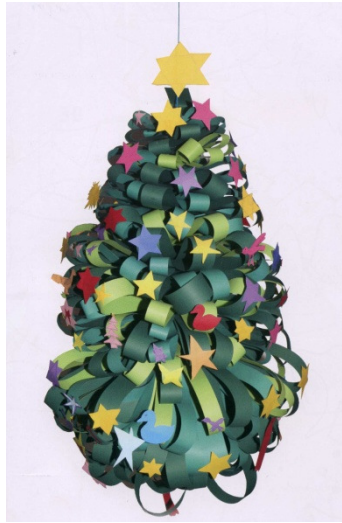
Hæð um 76 cm

Efni: Græn karton, karton í ýmsum litum og tímarit, bandspotti um 1 m á lengd og lím.