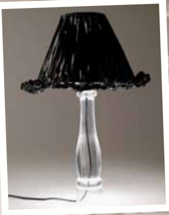
Lampi gerður úr endurunninni piparkvörn, grind úr lampaskermi og vídeospólu (þráður)