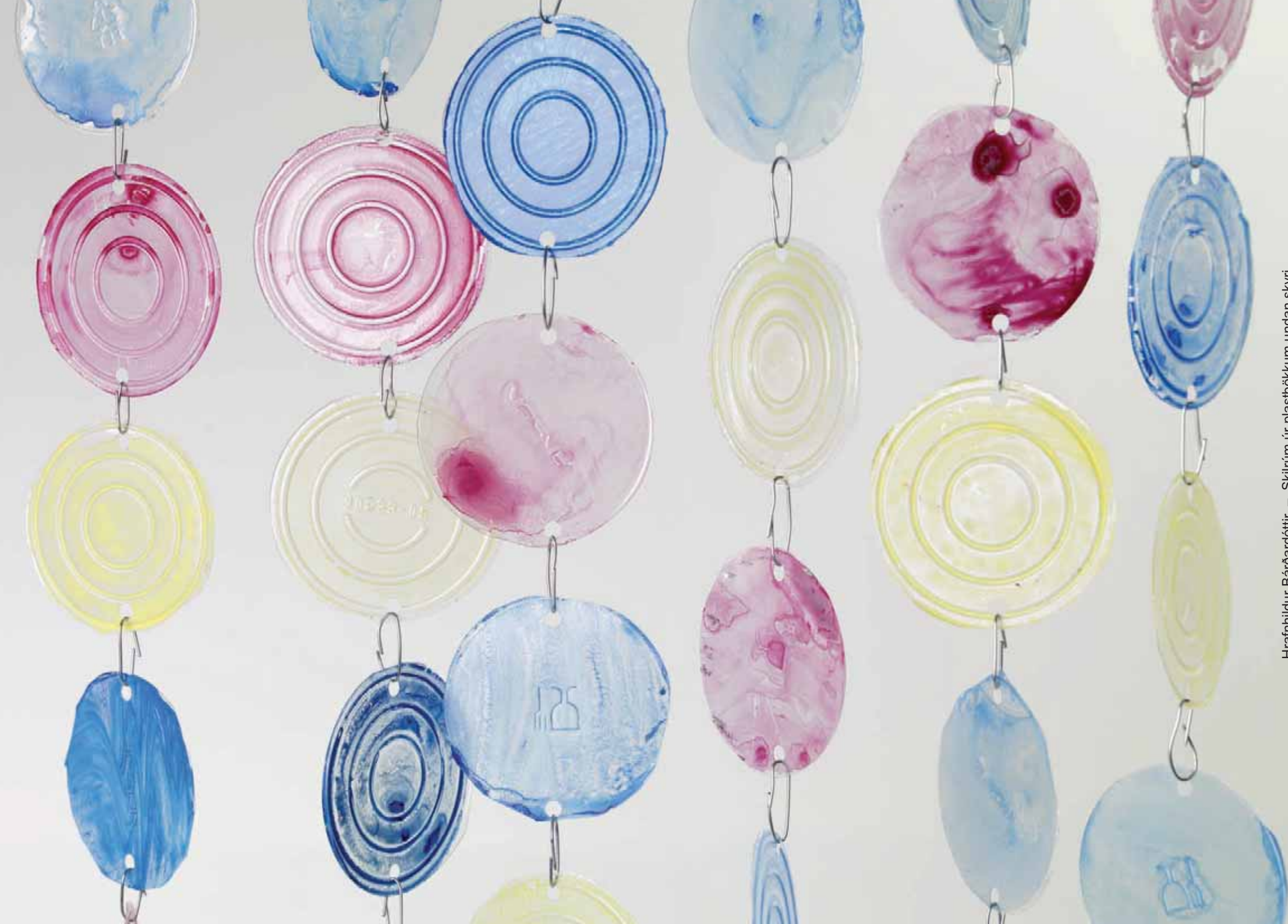
Hrafnhildur Bárðardóttir – Skilrúm úr plastbökkum undan skyri.