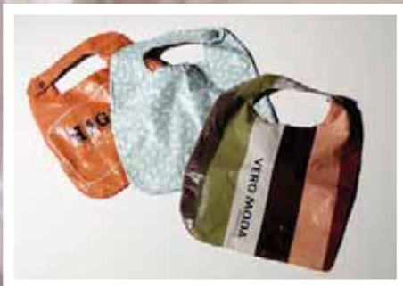
Smekkir úr plastpokum o.fl.