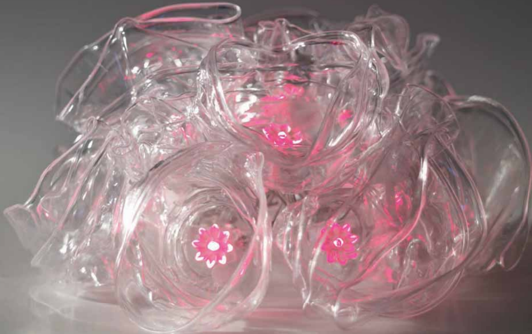
Guðrún Ísberg – Ljós úr bræddum plastglósum og jölaseríu.