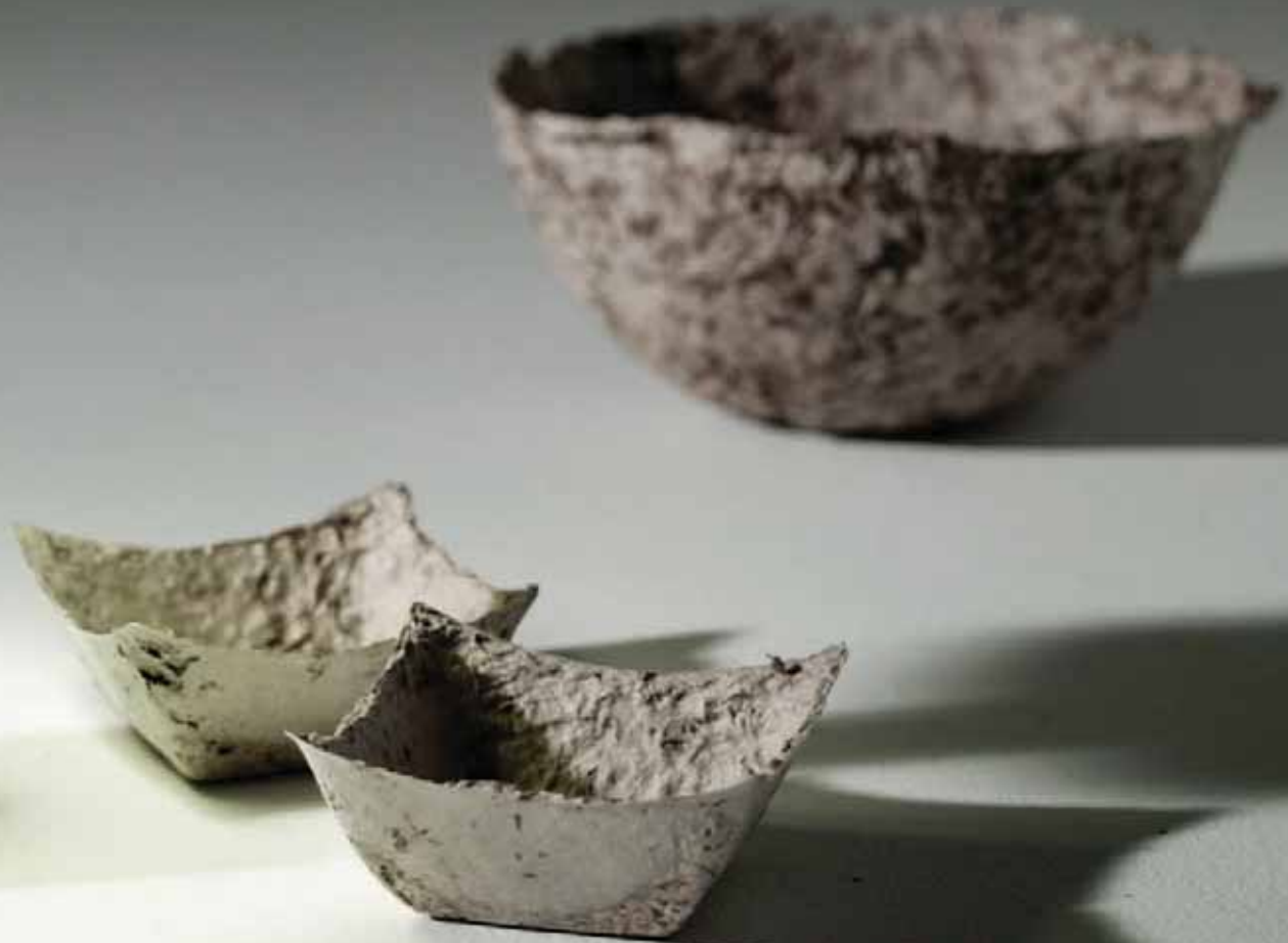
Hrafnhildur Bárðardóttir – Skálar og lampi úr dagblöðum og klósettrúllum.